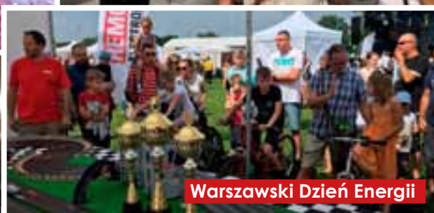
Warszawski Dzień Energii