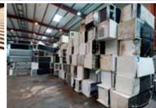
■ Zakłady przetwarzania zlokalizowane w Polsce pozwalają na przetworzenie w ciągu roku nawet do 70 tys. ton odpadów elektrycznych i elektronicznych.

Projekt Decydujesz.pl promuje ekologiczne nawyki przez wskazywanie potrzeby selektywnej zbiórki urządzeń i zwiększanie ilości zużytego sprzętu trafiającego we właściwe miejsce w celu jego dalszego przetworzenia zgodnie z obowiązującymi przepisami. Projekt ten zdobył II miejsce w konkursie „Przedsiębiorca Efektywny Surowcowo 2017” w kategorii „EKO-Hit Usługa”. Więcej informacji o nim dostępnych jest na stronie internetowej decydujesz.pl.