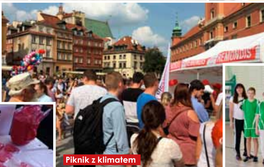
Piknik z klimatem