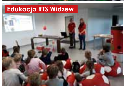
Edukacja RTS Widzew