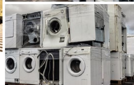
■ Zakłady przetwarzania zlokalizowane w Polsce pozwalają na przetworzenie w ciągu roku nawet do 70 tys. ton odpadów elektrycznych i elektronicznych.